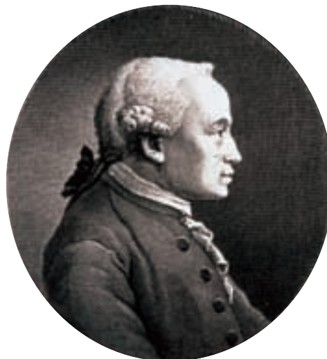
Kant condena el suicidio; no lo hace porque piense que la vida haya de considerarse como el supremo bien. Reconoce que «hay deberes a los que debe supeditarse la vida», como el deber de vivir con dignidad.

En las Epístolas morales a Lucilio, Séneca defiende con toda claridad el derecho a quitarse la vida, aunque no en cualquier circunstancia ni por una mera cuestión de moda 19 . La primera premisa del razonamiento de Séneca es que lo que es bueno no es el mero vivir, sino el vivir bien; en consecuencia, «el sabio ha de vivir