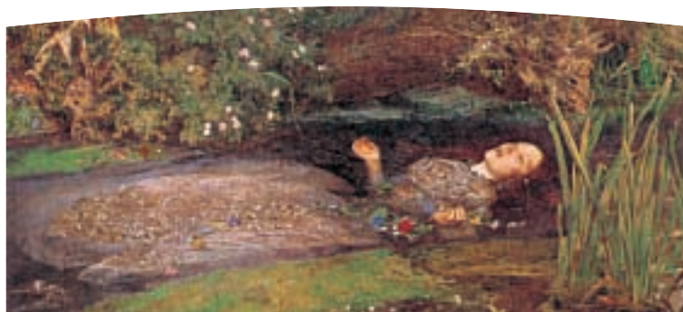
Ophelia, prometida de Hamlet, a la que William Shakespeare hace aparecer en su obra flotando ahogada en un río, es un probable caso de suicidio –eso sí, de ficción– debido a la desesperación y al desamor. ( Ophelia , de John Everett Millais.)

El segundo problema es de carácter ideológico. El concepto de suicidio es un «concepto interpretativo» que no puede definirse en forma «neutral» 5 . En nuestra cultura –en la cultura occidental–, la idea de suicidio suscita, en términos generales, un sentimiento de rechazo; cuando no se considera un pecado –el más grave de todos–, suele verse como una reacción patológica o como un tabú. Donnelly 4 cuenta el caso de un alto funcionario de los Estados Unidos que se suicidó ante las cámaras de televisión en 1987 el día antes de que fuera sentenciado a prisión por haber cometido fraude (sería, pues, un caso de lo que Durkheim llamaba suicidio anómico). Pues bien, al día siguiente, ningún periódico ni canal «respetable» de televisión retransmitió esa imagen aunque, desde luego, no hubiera habido ningún problema en hacerlo si se hubiese tratado de un asesinato a sangre fría o de alguna horrible masacre. Digamos que, en general, se tiende a evitar considerar como suicidio una acción que parezca moralmente justificada (como sucede con el rechazo frontal por parte de los autores cristianos a denominar suicida la conducta de los mártires cristianos o la del mismo Jesucristo). En definitiva, tienden a considerarse como