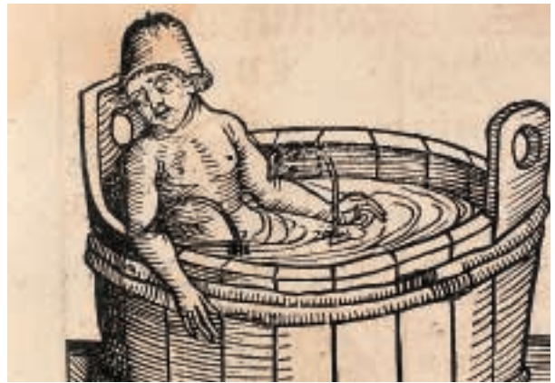
Según Séneca «el sabio ha de vivir tanto como deba, no tanto como pueda». Dado que la naturaleza ha permitido que el hombre pueda elegir su propia muerte, debe ejercer esa libertad suprema con total autonomía. (Suicidio de Séneca.)

La solución que da Santo Tomás al problema del suicidio es muy semejante a la de San Agustín; de hecho, él apela varias veces a la autoridad de éste. En la Summa Theologica , Santo Tomás afirma que es «absolutamente ilícito suicidarse», por las tres siguientes razones. La primera es que «el que alguien se dé muerte es contrario a la inclinación natural y a la caridad por la que uno debe amarse a sí mismo; de ahí que el suicidarse sea siempre pecado mortal, por ir contra la