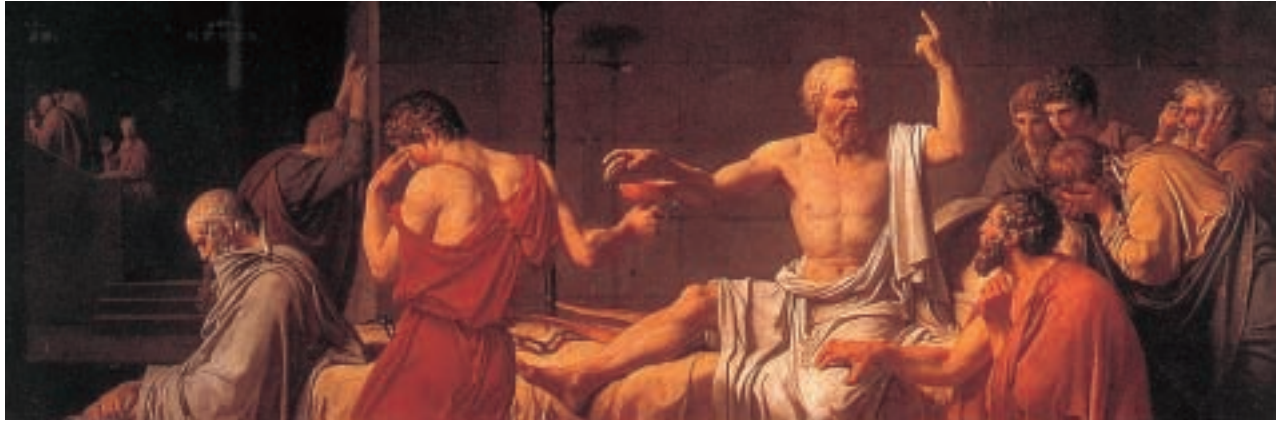
Sócrates fue condenado a beber la cicuta. A pesar de que la sentencia era injusta y de que hubiera podido escapar de sus guardianes, la cumplió por el deber moral de respetar la ley.

Ya en el siglo XVII, la Ordenanza criminal francesa de 1670, aunque en algunos aspectos sea una continuación en la línea de la represión medieval del suicidio, marca también el inicio de una nueva época en la consideración del suicidio que culmina con su total despenalización por obra de la legislación revolucionaria de 1789. En efecto, a lo largo del siglo XVIII, se va creando poco a poco, en parte mediante la difusión de los textos de los autores de la antigüedad que justificaban la muerte voluntaria, una corriente de opinión, que termina por ser mayoritaria, en favor de su despenalización. A pesar de ello, los textos jurídicos vigentes en muchos de los Estados y ciudades europeas prevén sanciones, incluidas sanciones infamantes, para el suicida. No obstante, en realidad, tal vigencia es sólo formal, pues las nuevas ideas filosóficas sobre el suicidio son asumidas tácitamente por los jueces, quienes en la práctica dejan de penar el suicidio (Marra, pp. 86-94).